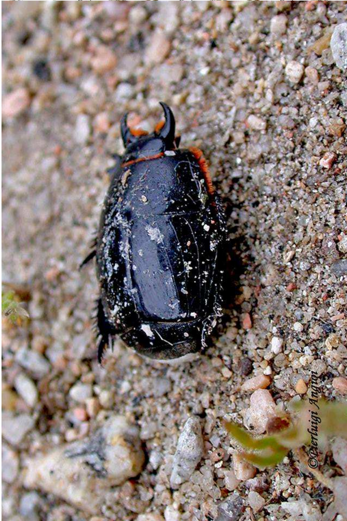
Pactolinus major (Linnaeus, 1767) – Histeridae